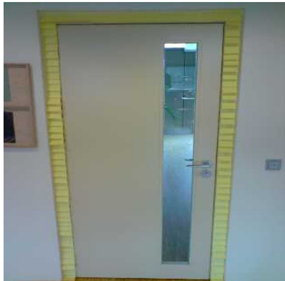
Intervention mit Post-its