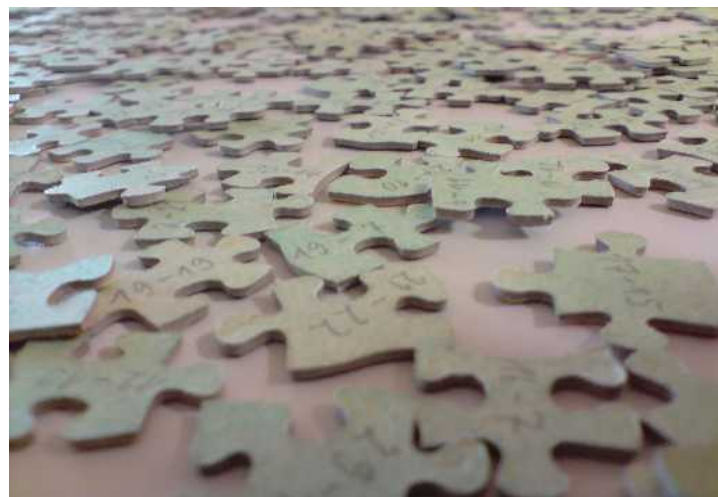
Puzzle auf links, durchnummeriert