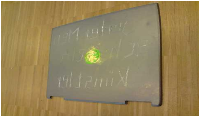
Skretching auf Laptop