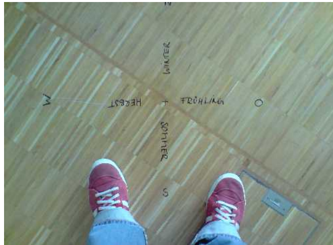
Verortung im Raum