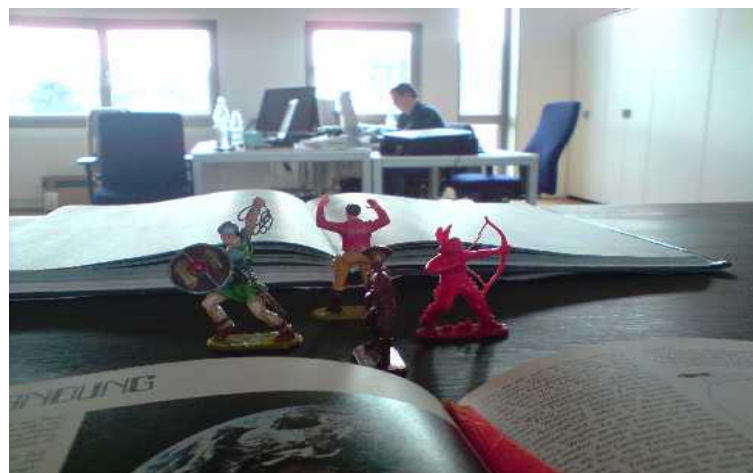
Figuren wandern durch den Raum